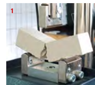
1 Biegezugfestigkeitsprüfung bei einem Fließestrich

Ein Trockenheizen des Estrichs durch Fußbodenheizung kann die Bauzeit um ca. 3 bis 4 Wochen verkürzen.