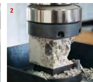
2 Druckfestigkeitsprüfung bei einem Fließestrich